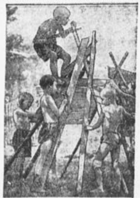
Октябрята Хамовнического дома пионеров (Москва) строят домик.

* Пионеры Мошинской школы, Волог. г., хотя выезжают в лагерь только на одну неделю, но думают провести с крестьянами агроучер и произвести практические работы по геометрии (измерение).