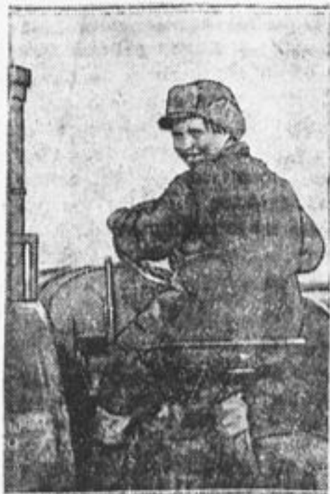
80 тыс. тракторов будет произведено на наших заводах к концу пятилетия.

* Один из немецких водолазов в новом водолазном костюме опустился на рекордную глубину в 200 метров.