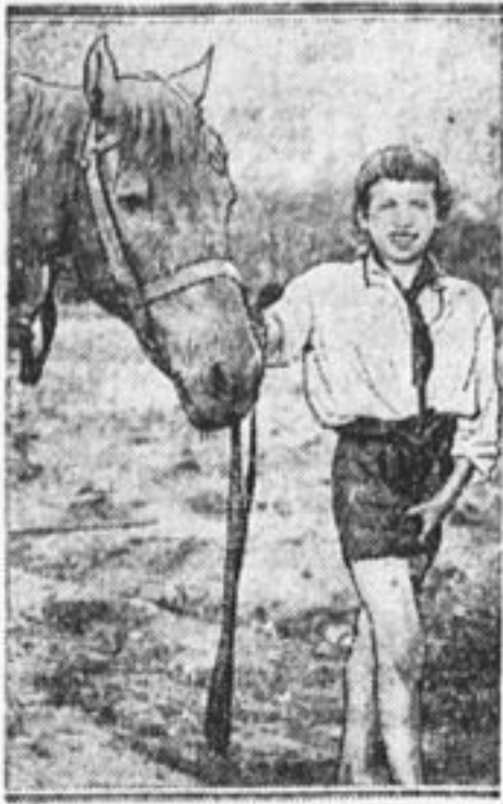
У евреев - земледельцев.