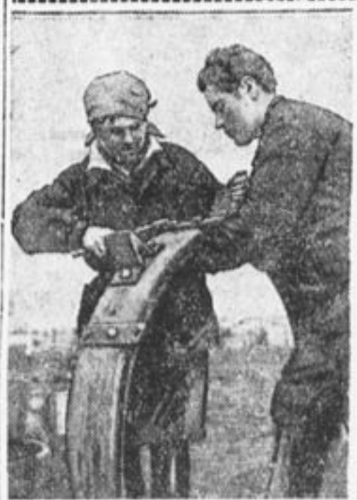
СОВХОЗ «БЕНАРДАКИ». Женщины-трактористки за работой.