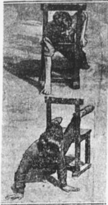
Комический бег с препятствиями

В дни всесоюзного слета штаб на средства культкомиссии фаб-