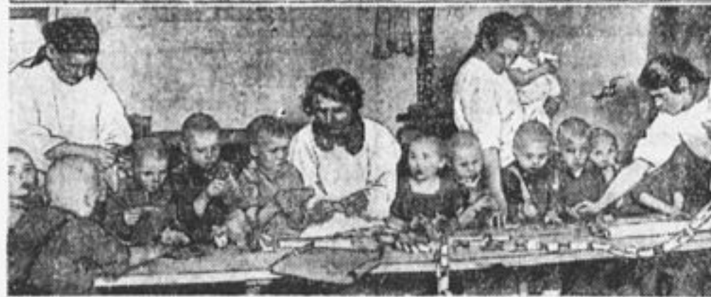
На детплощадке. Наступил обеденный час.