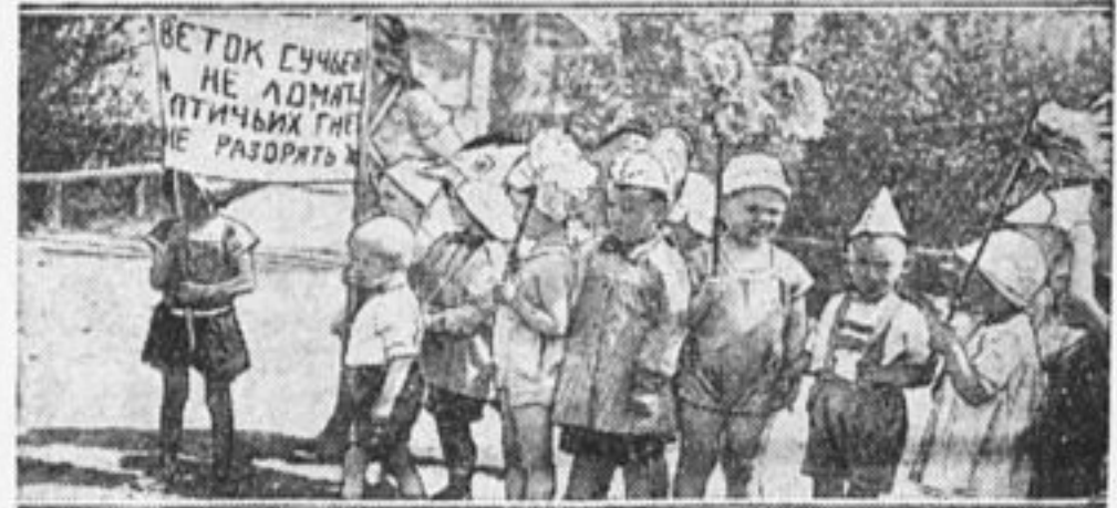
Демонстрация дошкольников в день леса.

Чтобы привлечь внимание ребят к книге, как к продукту человеческого труда, дайте им такую же занятую, полезную и